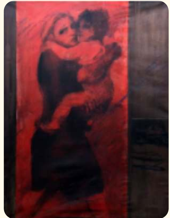
Gracia Barrios "El escritor y su hija escuchando a Edvard Grieg" 150 x 240 cm / Técnica mixta / 1993

Otra exponente de los aconteceres de la sociedad chilena es Gracia Barrios (1927-2020), pintora que narra en sus obras episodios trascendentes de la historia reciente de Chile.