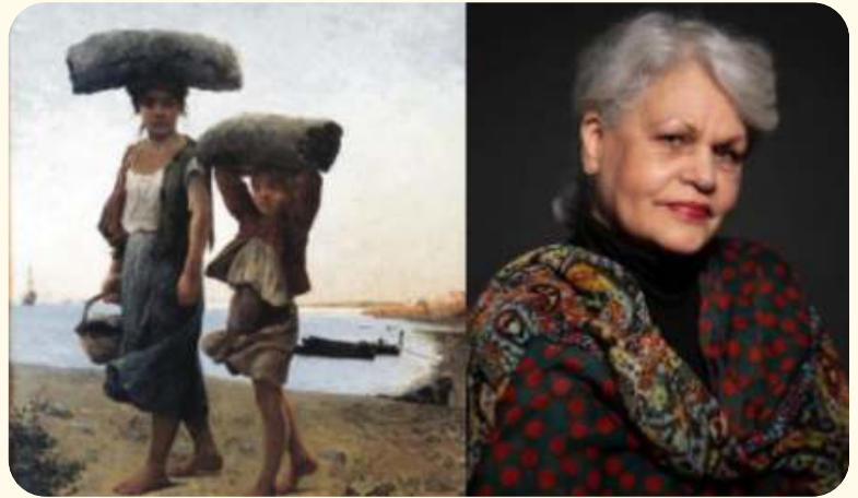
«Las playeras» tela al óleo obra de Celia Castro. 139cm x 188cm, hecha en 1889

En el siglo XIX y XX emergen las primeras organizaciones femeninas que buscan la equidad en derechos de la mujer en la sociedad, y en diferentes escenarios se van destacando mujeres que abrirán caminos. En Chile, en el arte, se destaca Celia Castro (1860-1930), pintora porteña y profesional del arte.