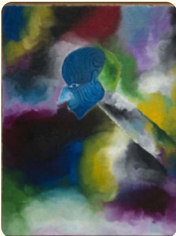
Violeta Parra "Retrato de Leopoldo Castedo" 78 X 59 cm / Óleo sobre tela / 1960

La historia avanza en la sociedad chilena. Hitos importantes permiten, poco a poco, considerar como ciudadana a la mujer; entre ellos se destaca el proceso del sufragio femenino. En 1934 se promulga la ley que permite a las mujeres ejercer su derecho a votar en las elecciones municipales y, en 1952, finalmente votan en las elecciones presidenciales. Las mujeres artistas también transitan con la historia, expresando en sus obras la identidad de nuestra sociedad y el reflejo de los cambios. Aparece Violeta Parra (1917-1967), mujer vanguardista, con una profunda convicción y compromiso social. Siendo música, también exploró lo visual con sus arpilleras, cerámicas y pintura al óleo.