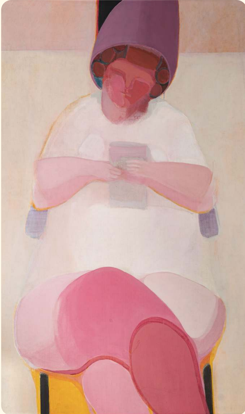
© Roser Bru, VEGAP, Gerona, 2024.

Panorama actualizado de actividades culturales en la Región de Valparaíso. Incluye exposiciones, inauguraciones, conversatorios y eventos destacados del mes, promoviendo la participación y el encuentro entre artistas, espacios y comunidad.