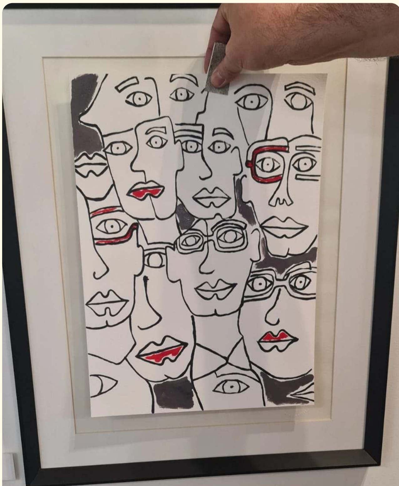
Andamos todos juntos Monotipia sobre papel 29.7 cm x 42 cm

"Más que un proyecto para redes sociales, terminó convirtiéndose en una manera de mirar y de trabajar todos los días."